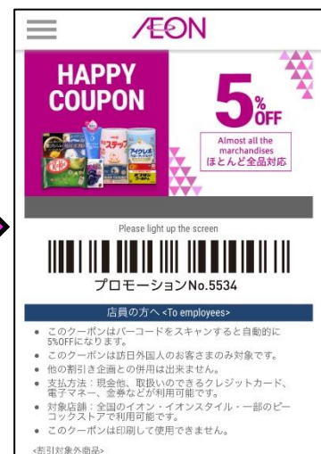
バーコードをレジに提示