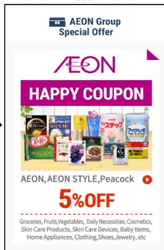
5%割引クーポン発行