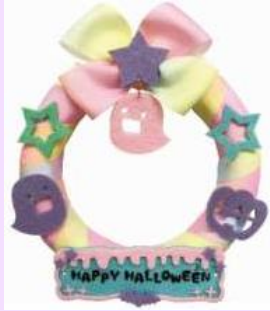
ハロウィン リース