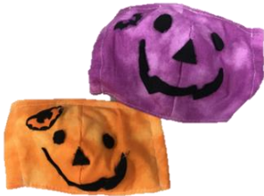
ジャックオランタン フェイスマスク