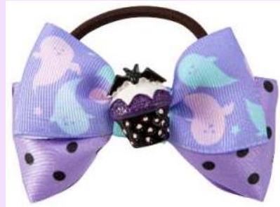
ハロウィン ヘアアクセサリ