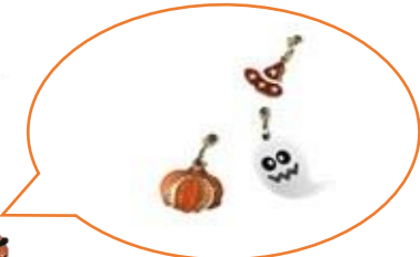
チャーム付きマスク