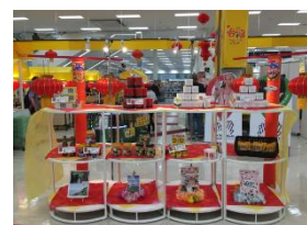
イオン熊本店での台湾フェアの様子

イオン九州は、2014年11月に台湾の旅行代理店とインバウンド事業に関する取り組みをスタートしました。2015年10月以降は他事業分野を開発するため、年に数回、台湾の各市政府との相互交流を開始。2017年3月にはイオン直方店（福岡県直方市湯野原）で台湾直轄市の「特産品展示会」、2018年8月にはイオン熊本店（熊本県上益城郡嘉島町）で「台湾フェア」を開催しました。2020年以降、コロナ禍でインバウンド事業が停滞する状況でも交流を継続しています。