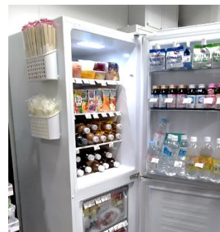
西部ガス情報システム㈱さま オフィス 導入時の様子