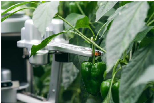
アームで収穫する様子

◆実施内容:ピーマン自動収穫ロボット『L』の展示 及びピーマン収穫実演デモンストレーション