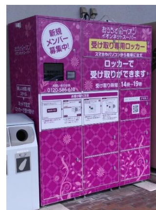
受け取り専用ロッカーイメージ

*「ロッカー受け取り」は11時までのご注文で当日15時～19時となります。専用ロッカーは1階入口にございます。