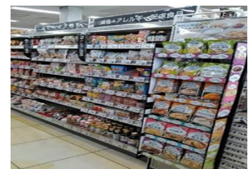
ナッツ・ドライフルーツ

有機JAS認証のオーガニック野菜やドライフルーツを品揃えするほか合成保存料・香料・化学調味料不使用のナッツ類コーナー「ナッツスナッキング」や、化学調味料無添加でカロリーを気にせず食べられる「ヘルシースナック」を新しく取り扱います。また、プロテインバーをはじめ、大豆ミートをはじめとする植物性代替食品コーナーでは健康と環境に配慮した商品を品揃えいたします。