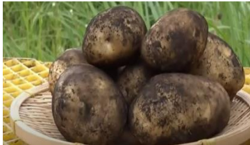
7月上旬 立派な有機栽培のじゃがいも！