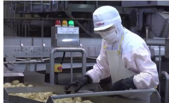
7月中旬 カルビー鹿児島工場にて加工