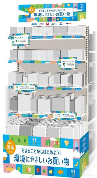
分科会①サステナブル共同販促 実施イメージ

賛同する流通企業5社の店舗（約310店舗）にて、2023年6月の環境月間に合わせた『サステナブル共同販促』を実施します。各社で選定したサステナブル商品を、共通の販促ツールを用いて展開し、お客さまに対してサステナブル商品とその背景や社会的役割を訴求します。商品選定基準として認証ラベル6種等を採用し、環境保全に寄与する認証ラベルの認知～消費拡大にも努めます。