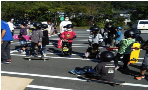
ホームワイド賀来店でのスケートボード体験会の様子