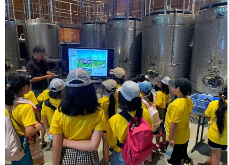
ぶどうジュース・ワインができるまでの工程も学びました

ぶどうの樹ワイナリーにて醸造されたオリジナル赤ワインは、早仕込みの新酒ワインでしっかりとした色とタンニンを楽しんでいただけるキレのある辛口に仕上がりました。