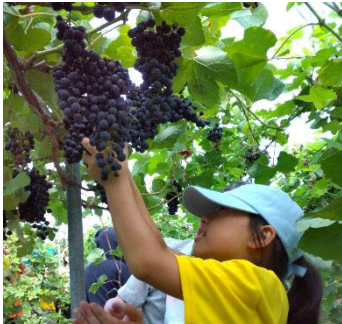
一生懸命ぶどうを収穫するイオン チアーズクラブメンバー

イオン九州では、体験学習の1つとして今年の8月末に福岡県岡垣町にある「ぶどうの樹ワイナリー」のぶどう畑にてイオン チアーズクラブの子どもたちが収穫体験をし、その後にはぶどうジュース・ワインができるまでを学びました。今回発売する赤ワインには、イオン チアーズクラブの子どもたちが収穫したぶどうの一部が原料として含まれています。