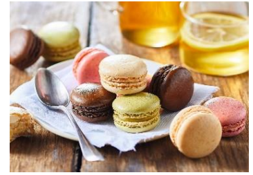
4種類のマカロン (チョコレート、フランボワーズ、 バニラ、ピスタチオ)

高品質な冷凍食品としてフランスの国民に愛され、好きなブランドトップ10に毎年ランクインする人気ブランドです。添加物の使用をできる限り控え素材本来の味を生かし環境にも配慮した商品で、前菜からデザートまで、幅広く取り揃えています。冷凍状態で保存されているため長時間保存でき、作りたてのおいしさと食感を楽しむことができます。