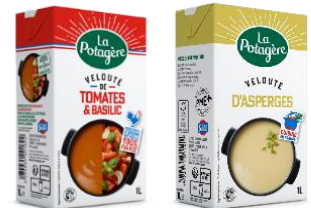
左) ラ・ポタジェールトマトとバジルのスープ

価 格：トマトとバジルのスープ 1,030g 本体398円（税込429.84円） アスパラガススープ 1,030g 本体498円（税込537.84円）