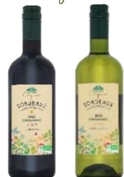
トップバリュ グリーンアイオーガニック オーガニック AOP ボルドー 左) ルージュ 右) ブラン