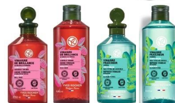
イヴ・ロシェ リンシングビネガー 左) ラズベリー各種 右) モリンガ各種