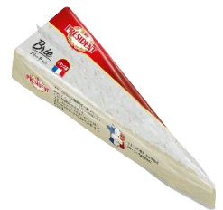
PRESIDENT ブリーチーズ 90g

特 長：ヨーロッパチーズNo.1ブランド「PRESIDENT」ブリーチーズはマイルドでミルキーな味わいが特長です。パンやクラッカーとともにお楽しみいただけます。