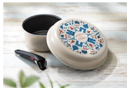
T-f a l パリ・コレクション

価格帯：本体2,980円(税込3,278円) ～本体7,980円(税込8,778円) 品目数：3品目