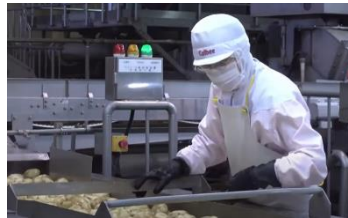
7月下旬 カルビー鹿児島工場にて加工