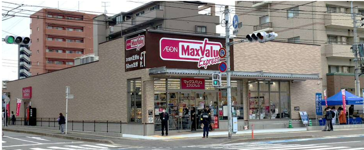
※写真は店舗イメージです。

当店は、「近くて便利な、コンパクトスーパーマーケット」をコンセプトとし、地域のお客さまの毎日の暮らしに必要な生鮮食料品・加工食料品・お酒・お弁当・お惣菜などを取り揃え、お客さまの生活のお役に立てるお店を目指して、年中無休で営業いたします。