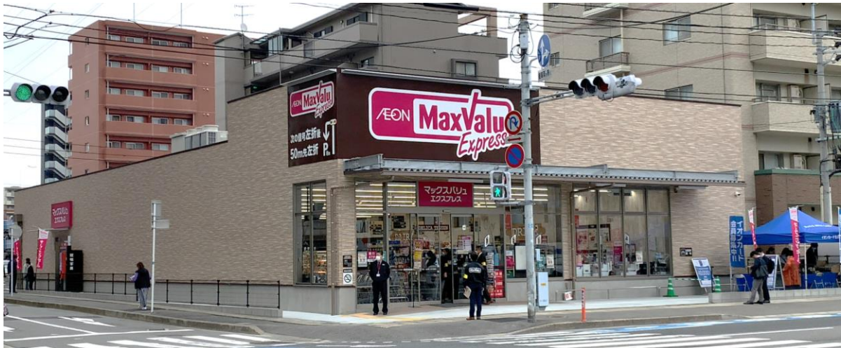
※写真は店舗イメージです。

当店は、「近くて便利な、コンパクトスーパーマーケット」をコンセプトとし、地域のお客さまの毎日の暮らしに必要な生鮮食料品・加工食料品・お酒・お弁当・お惣菜などを取り揃え、お客さまの生活のお役に立てるお店を目指して、年中無休で営業いたします。