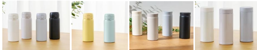
<ワンタッチマグボトル> <パッキン一体型スクリューマグボトル> <シンプルマグボトル>