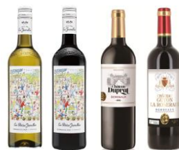
フランス産ワイン