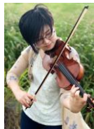
アコーディオン&バイオリン二重奏