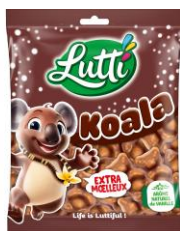
Lutti コアラ・ミルク (マシュマロとチョコレートがけ)