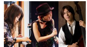
YORI trio (ヨリトリオ)