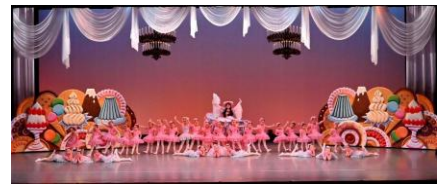
バレエステージ バレエブランアート