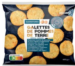
ピカール ジャガイモのガレット