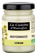
ラ・キュージヌ・ドートルフォワ レモン風味マヨソース