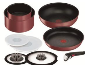
ティファール イオンジニオ・ネオ IHモーヴレッド・アンリミテッドセット9