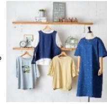
再生された繊維を 使用した商品

エシカルファッションブランド 「SELF+SERVICE（セルフサービス）」では 不要になった衣料品や端材から再生された 繊維を一部に使用した商品を展開しています。 さらに、オーガニック素材を使用した対象 商品 1 点につき 10 円を、こども食堂への 支援活動や綿産地のこども支援のために 寄付をします。