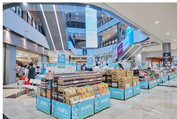
※特別催事店舗での展開イメージ