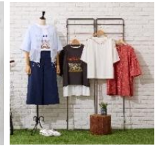
オーガニック素材 を使用した商品