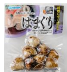
原料原産地：台湾 台湾はまぐり (真空パック)