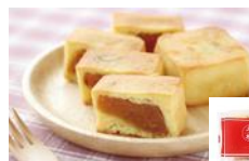
お土産に最適！パイナップルケーキ