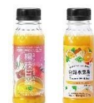
フルッタフルッタ 楊枝甘露（ヨンジーガムロ） 台湾フルーツティー