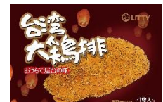
グローリー LITTY 台湾大鶏排