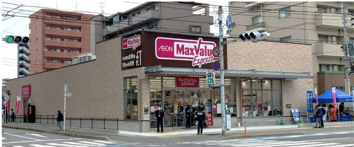
※写真は店舗イメージです。

当店は、地域のお客さまの毎日の暮らしに必要な生鮮食料品・加工食料品・お酒・お弁当・お惣菜などを取り揃え、お客さまの生活のお役に立てるお店を目指して、年中無休で営業いたします。